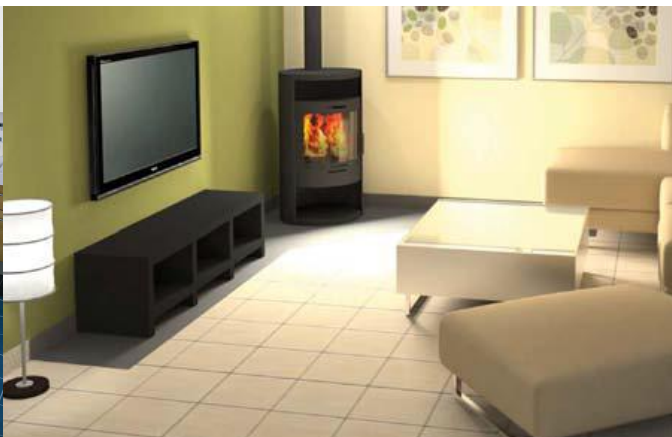
Укладка плитки в системе «теплый пол»