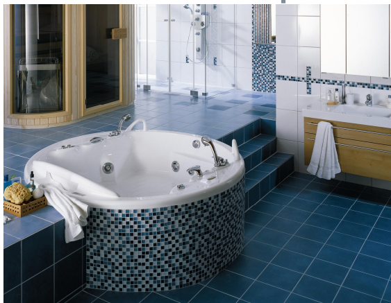
Во влажных зонах